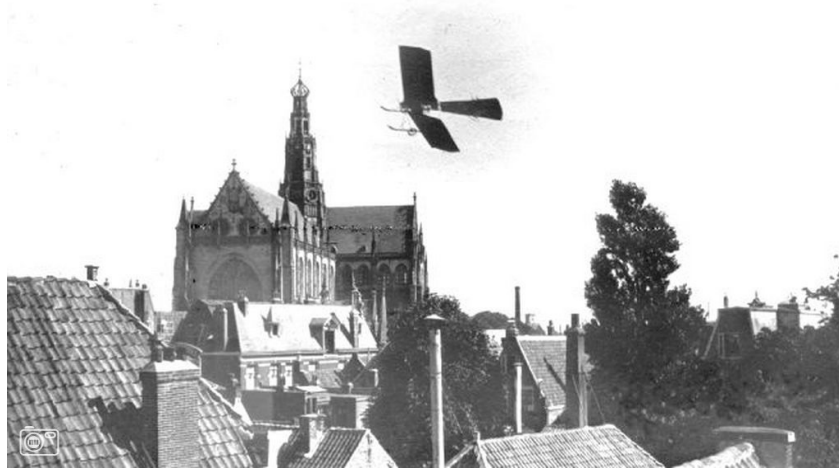
Fokker vliegt om de Sint Bavo.

ogenblik zijn winden vergeten om een slag rond te draaien uit pure verbazing?; en is de oude grijsaard, die al eeuwenlang te dromen staat bovenuit het dakengewirrel en 't nog lagere menschengeroes beneden, niet plots wakker geschrikt en heeft hij niet, al is 't een oogenblik maar, zijn Damiaten klokjes gebengeld van verrassing, toen daar over zijn hoofd heen, wel driehonderd meter en bovenuit die vreemde vlinder opdoemde?