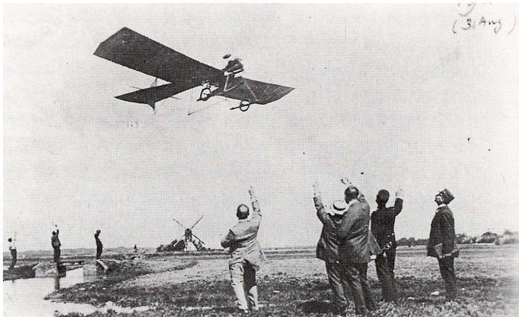
Fokker demonstreert tijdens de Koninginnefeesten te Haarlem, augustus/september 1911. Op de achtergrond molen de Stoop aan de Heussensstraat.