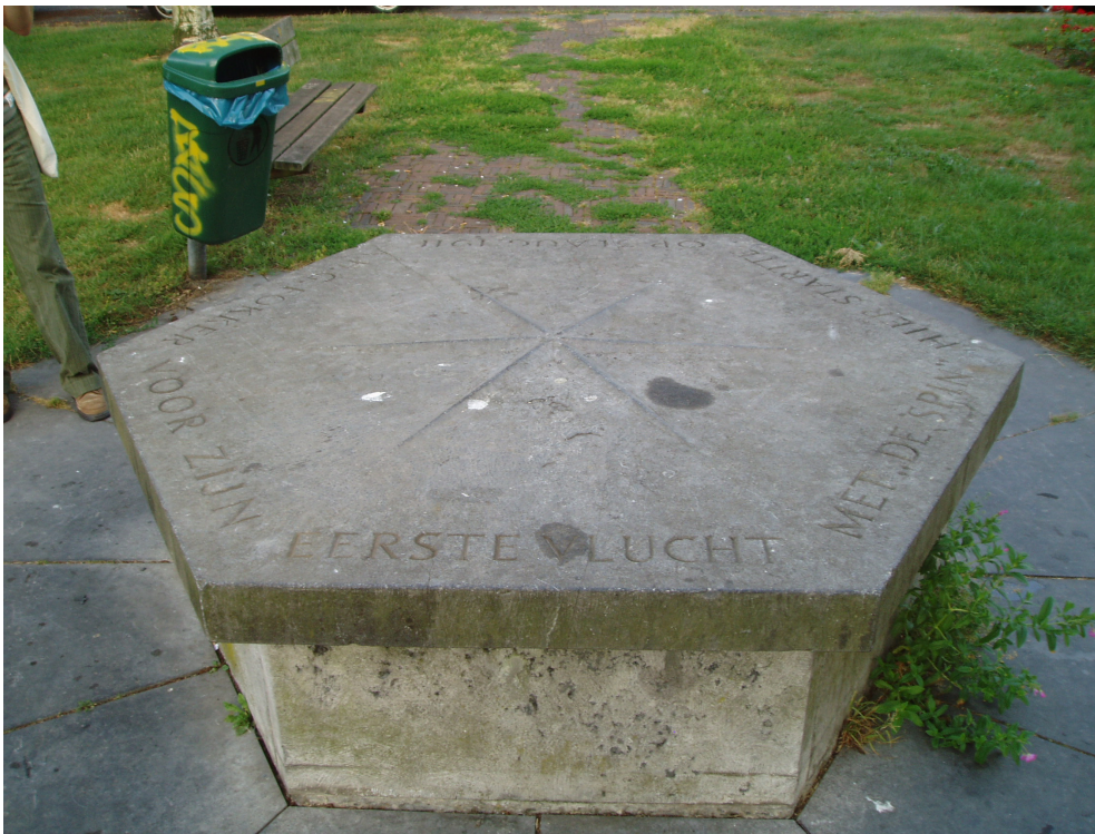
De gedenksteen in 2006