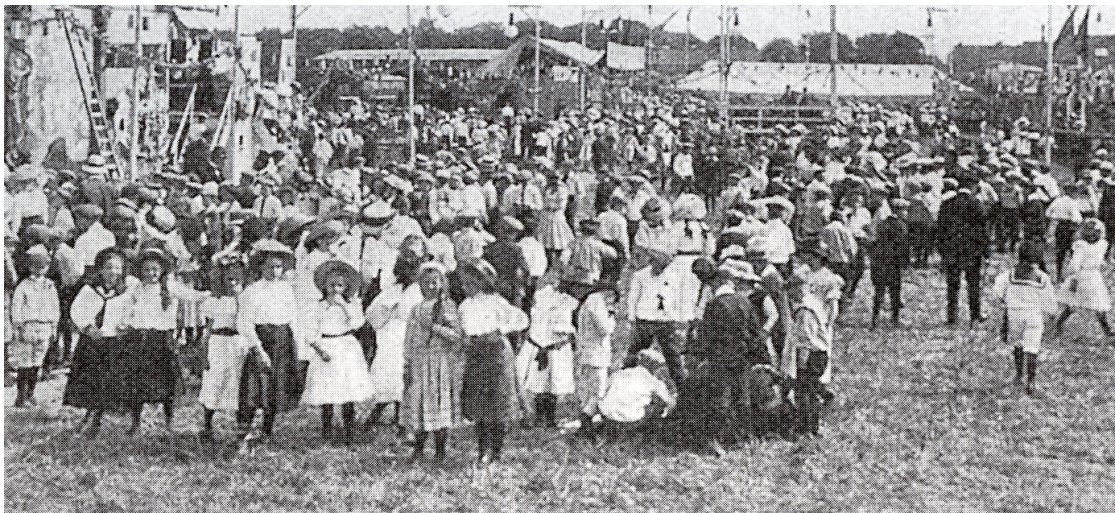
Feestelijke gezelligheid aan de Kleverlaan, augustus 1911.

In het plantsoen aan het Santpoorterplein ligt nu een kleine gedenksteen die herinnert aan deze demonstratievlucht. Deze steen werd op 31 augustus 1961, vijftig jaar na data, in het bijzijn van vele genodigden officieel onthuld. Gelijktijdig werd een tentoonstelling gehouden in de Vleeshal.