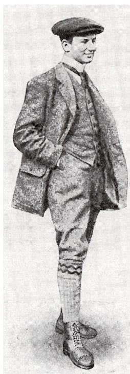
Fokker in Haarlem

A.H.C. (Anthony) Fokker, geboren op 6 april 1890 te Blitar op Java, kwam op 4-jarige leeftijd naar Haarlem, waar hij met hangen en wurgen een schoolopleiding volgde. Hij was toen al zo geïnteresseerd in technische zaken dat de 'normale' lessen aan hem voorbij gingen. Via een mislukte uitvinding (anti-plofband), die kort daarvoor al door iemand anders was ontwikkeld, kwam hij in opleiding bij een autovakschool in Mainz. Daar werd tevens een cursus voor vliegtuigconstructeur en aviateur verzorgd. Hier voelde hij zich geheel thuis en hij ontwikkelde zich als de technicus die in later jaren zoveel beroemde vliegtuigen zou lanceren.