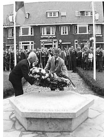
De onthulling van de gedenksteen, augustus 1961, vijftig jaar na de vlucht.

Toen Fokker het terrein in Haarlem inspecteerde, maakte hij bijna meteen rechtsomkeert! Niet alleen was het terrein door sloten doorsneden, maar bovendien had de politie bepalingen voor het vliegterrein uitgegeven. Het woord 'bepalingen' werd in die zin letterlijk genomen dat, om het publiek te beschermen, hoge palen op 4 m afstand van elkaar om het veld moesten verrijzen 'waarover en -achter niet gevlogen mocht worden'. Misschien had de verantwoordelijke politieman het 'vliegen als ene vogel' wat al te letterlijk genomen, maar Fokker maakte terecht bezwaar en de discussies voerden zover dat het comité al toespelingen begon te maken op 'twijfelachtige vliegekunde'. Toen de leden ervan echter Fokker eenmaal hadden zien vliegen, moesten ze toegeven dat ze niet voor niets zoveel geld hadden uitgegeven. De demonstraties, zouden behalve op Koninginnedag ook nog op de eerste dagen van september werden uitgevoerd.