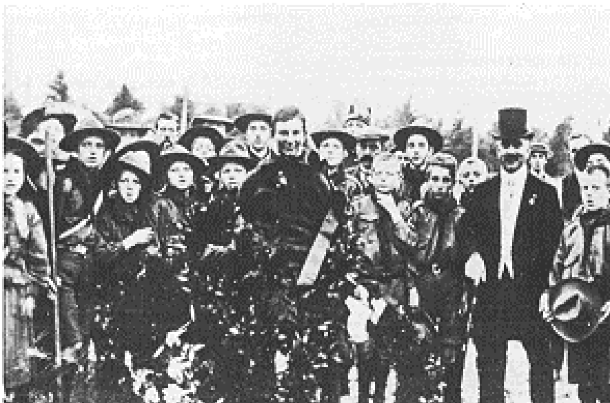
Huldiging van Fokker te Haarlem, september 1911.

Fokker had een prestatie van formaat geleverd. Zijn vliegtuig dat bij Goedecker was gebouwd, had een lengte van 7,30 meter en de spanwijdte van de vleugels was 11 meter. De vleugels werden op spanning gehouden door kabels, die met de romp waren verbonden. Daardoor leek het net alsof de 'aviateur' als een spin in zijn web zat. Fokker kreeg als dank voor zijn optreden van de organisatoren, behalve de afgesproken onkostenvergoeding en de gebruikelijke kransen, een fiets die rijkelijk met bloemen als vliegtuig was versierd.